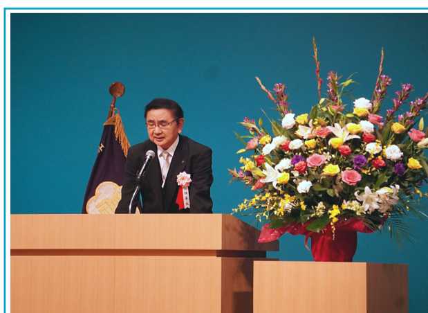
エクセラン高校創立70周年記念式典にて、理事長として挨拶する。