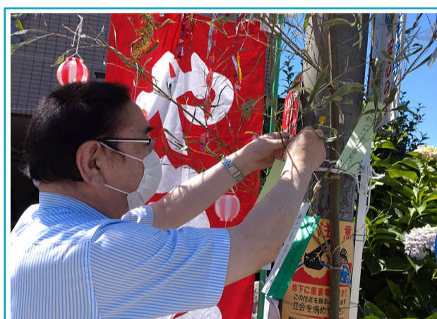
今年で20年を迎える御徒町七夕祭りに参加。願いを込めて笹に短冊を飾る。