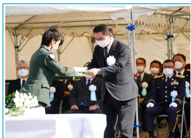
長野県自衛隊殉職隊員追悼式に参列。