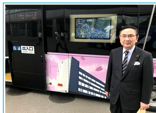
総務企画警察委員会にて伊那市自動運転バスを視察する。