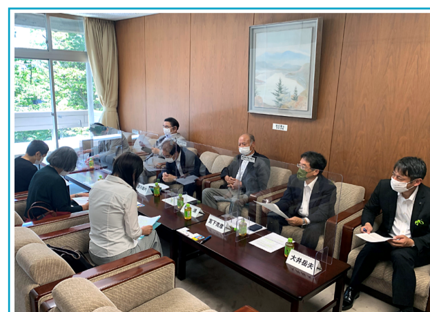
長野県栄養士会の皆様と意見交換を行う。